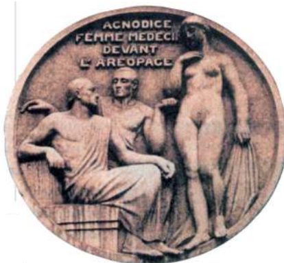
Arte em Relevo - Medalha Exposta na nova Faculdade de Medicina de Paris

N a Grécia Antiga, vivia Agnódice (ou Acnodice), uma mulher que possuía enorme desejo de ser médica. O grande problema é que, na época, era absolutamente proibido que mulheres exercessem a profissão no país.