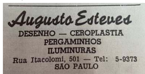
Anúncio na Rev. Bras. Hist. Med. 1952