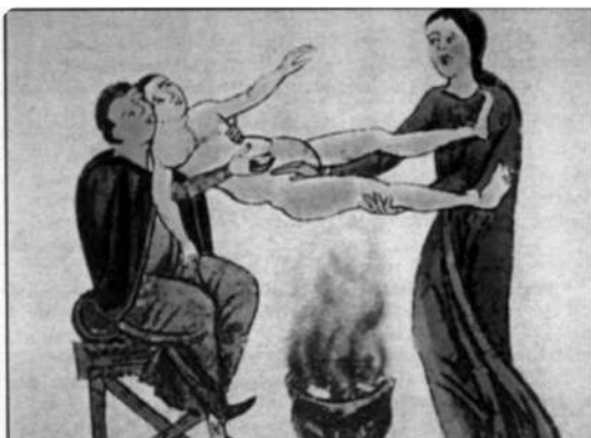
Vapores aromáticos para absorção pela vulva na era medieval

O denominado Papiro Kahun (de aproximadamente 1850 a.C.) era dedicado totalmente ao estudo das doenças e da gravidez e foi descrito como “tão usado que seu proprietário teria precisado consertá-lo com remendo”.