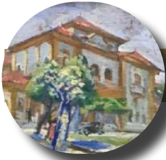
Imagem em medicina