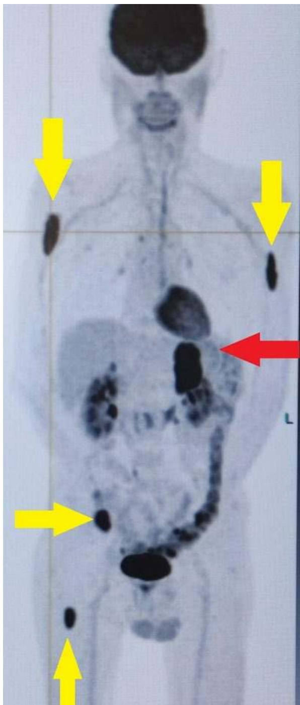
Figura 3. PET-CT axial demonstrando volumosa massa suprarrenal esquerda com intensa captação metabólica (seta vermelha), associada a múltiplas metástases ósseas hipercaptantes em úmero, costelas e fêmur (setas amarelas).