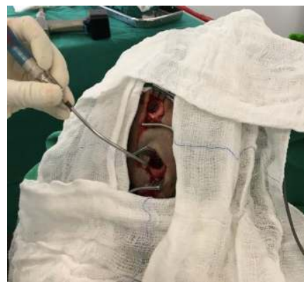
Figura 2: Trepanação em regiões frontal e parietal para drenagem do HSDC.

Paciente foi submetido à drenagem cirúrgica do HSDC com posicionamento de dreno subdural (Figura 2), retirado no segundo dia pós operatório. Paciente evoluiu com boa resposta ao tratamento, porém com sequela de hemiparesia à esquerda.